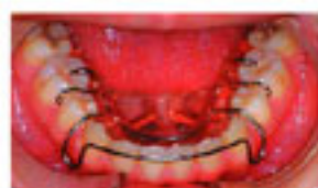
ウェッジプレート