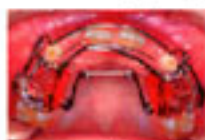
取り外しの拡大装置