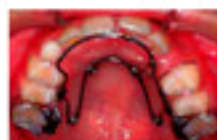
クワッドヘリックス (固定式拡大装置)