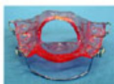
タングリトレーナー