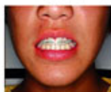
セラミックブラケット