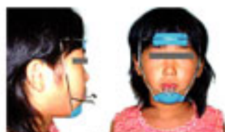
フェイシャルマスク (上顎を前方に成長)