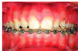
矯正治療中の口腔清掃不良によるう蝕