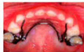
クワッドヘリックス (固定式拡大装置)