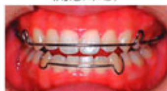
リテーナー（治療後の後戻りを防止）